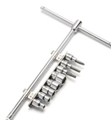
Yamaha Sliding T-Driver Set