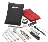
Metric Tool Kit